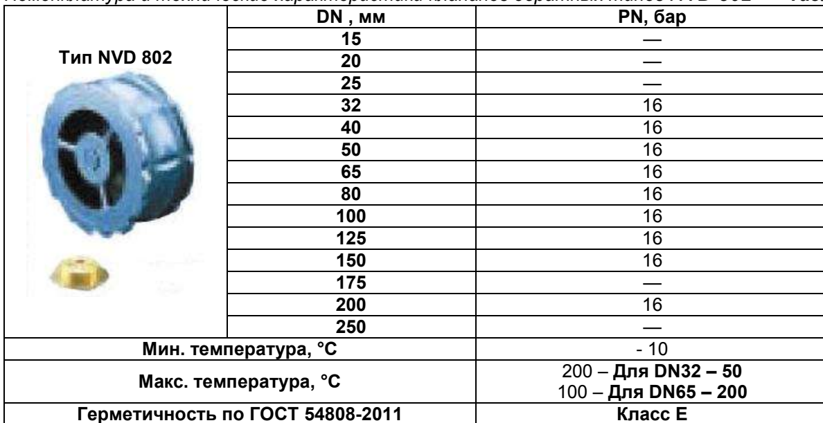
Номенклатура и технические характеристики клапанов обратных типов NVD 802 Таблица 1.